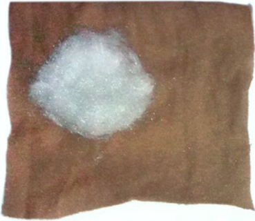
Cabeza / Head